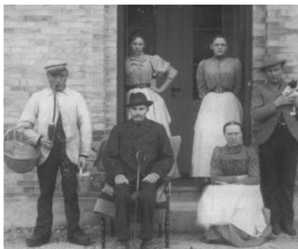
Personalebillede fra begyndelsen af 1900-tallet

Behandlingen var åben for alle patienter i amtet, dog kunne de kun blive indlagt, hvis de på forhånd kunne stille sikkerhed for betalingen. Behandling af akut tilskadekomne og patienter med akut livstruende sygdom samt patienter med epidemiske sygdomme (tyfoid feber, difteritis, strubehoste) var dog undtaget for denne regel.