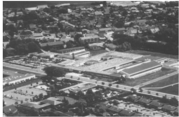
Farsø Sygehus 1993

Først i forbindelse med Amtsrådets nye reviderede sygehusplan i 1982 blev det besluttet at udvide sygehuset. Byggeriet skulle dog lade vente på sig indtil begyndelsen af 1990-erne. En ny stor medicinsk afdeling med 60 sengepladser blev bygget samtidig med at undersøgelses- og behandlingsfaciliteter blev udvidet. Fysio- og ergoterapifunktionen blev flyttet fra Løgstør til Farsø, da man i forbindelse med sygehusreformen havde nedlagt Løgstør Sygehus. Det store nybyggeri stod færdig i 1993.