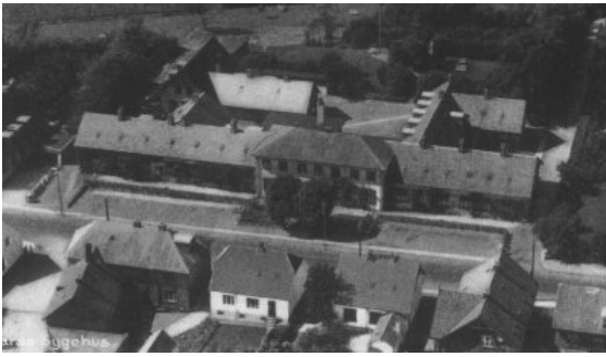
Farsø Sygehus i 1950

I forbindelse med Amtsrådets overvejelser om den fremtidige sygehusstruktur i området, blev det i 1961 besluttet at opføre et nyt og moderne sygehus med både medicinsk og kirurgisk afdeling. Sygehuset skulle dække behandlingsbehovet for hele Vest-Himmerland.