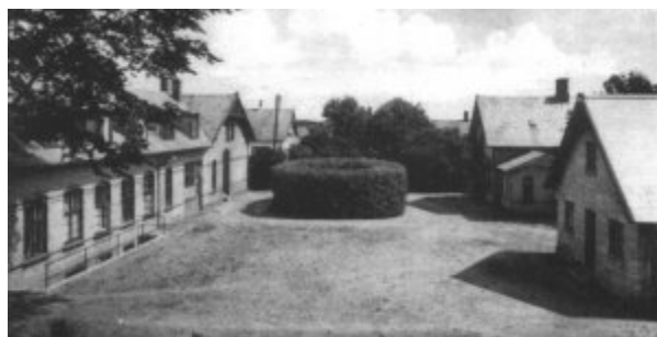
Farsø Sygehus i midten af 1930-erne.