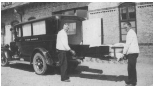
Sygebilen i 1922

De medicinske og kirurgiske behandlingsmuligheder gennemgik en kraftig udvikling i disse år, hvilket kunne ses i at antal indlæggelser og sygedage steg stødt i den efterfølgende tid. Sygehusets pladmæssige kapacitet var ved at være nået. Dette medførte i 1915 opførelse af en sidefløj til hovedbygningen med ny operationsstue og badeværelse. I samme seance blev køkkenet udbygget og indlagt rigtigt wc. Fremgangen fortsatte. Der var blevet flere sengepladser, og det resulterede i endnu flere patienter. I 1921 nåede antallet op på over 300 med omkring 80 operationer. Amdsrådet besluttede derfor i 1923 en yderligere udvidelse. Denne skulle omfatte en ny sengefløj og diverse forbedringer i de bestående bygninger, bl.a. indlæggelse af centralvarme og et varmtvandsanlæg i hovedbygningen.