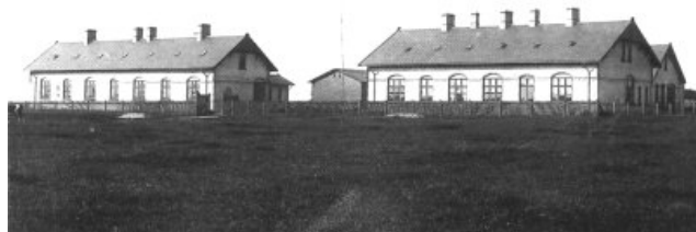
Farsø Sygehus 1895. Bygningen til venstre er for patienter med smitsomme sygdomme

Opførelsen af et Syge- og Epidemihus i Farsø udbydes herved i samlet Entreprise. Tegninger og Betingelser m. v. ere indtil den 26. d. M. fremlagte til Eftersyn paa Stiftamtskontoret, hvortil skriftlige forseglede Tilbud indsendes inden den 1. September d. A. Aalborg Stiftamt, den 15. August 1893. Wahl.