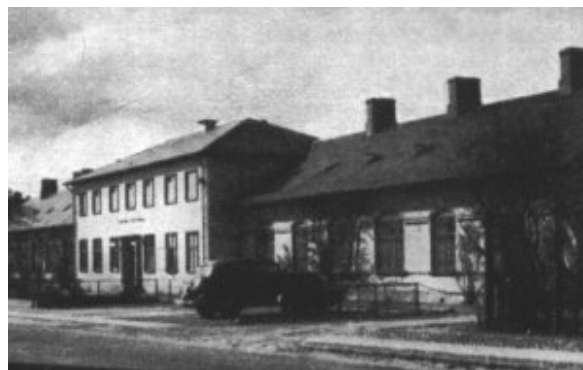
Farsø Sygehus med tilbygning fra 1937/38

I årene 1937-38 blev sygehuset igen udvidet. Det skete på baggrund af stadig stigende antal behandlinger. En ny operationsfløj med to operationsstuer og en ny køkkenbygning blev opført. Det samlede sengetal blev øget til 50. De to eksisterende gamle bygninger blev forbundet med en toetagers mellembgning, som kom til at indeholde røntgen-, lys- og massageafdelinger.