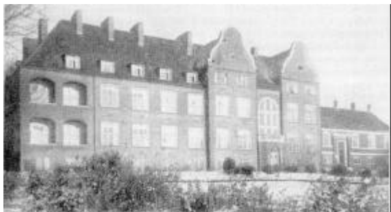
Thisted Sygehus efter ombygningens første etape i 1923.

epidemibygningen nedlagt. Tuberkulosepatienterne skulle nu til Krabbesholm Sanatorium i Skive. Epidemibygningen blev senere indrettet til medicinsk afdeling og senere igen til fysio- og ergoterapi. Tuberkulosesanatoriet blev i første omgang indrettet til øre-næse-hals klinik og tuberkulosestation og senere til sygehusadministration.