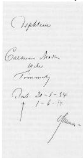
Side fra sygehusets ældst bevarede journal, der blev brugt på epidemihospitalet. Landsarkivet i Vibore.

Ellers var hensigten med sygehuset at skaffe de syge i distriktet et sundt og godt lokale i nærheden af lægen, hvor behandlingen kunne kontrolleres, og "hvor syge Tjenestetyende kunne erholde Kur og Pleje, når Husbond dertil savnede Plads og Lejlighed".