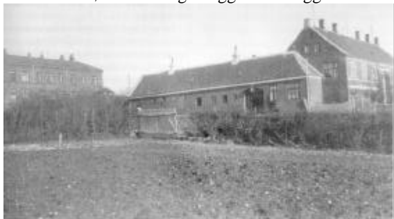
Thisted's første sygehus med det senere tilkomne epidemisugehus i baggrunden.

skulle opføre sig anstændigt i sygehuset, tage sin medicin ordentligt, følge lægens forskrifter i det hele taget og "ej forårsage Støj eller Uorden". Man må "ej forlade sit Værelse uden Tilladelse og ej modtage Besøg uden efter skriftlig Tilladelse fra Lægen". Man måtte ikke medbringe sine egne sengeklæder; dog kunne mødre, som indlægges med "Pattebørn" medtage vugge med vuggeklæder.